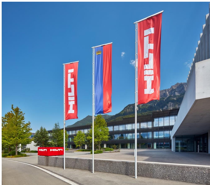
Ústřední ředitelství firmy Hilti sídlí od roku 1940 v městečku Shaan.

Čtvrtý nejmenší stát v Evropě a šestý na světě (162 km 2 , 39.700 obyv.), ležící uprostřed Alp mezi Švýcarskem a Rakouskem. se drží na předních příčkách světových statistik i v dalších oblastech. Na prvních příčkách v hodnocení zemí se už půl století umisťuje kvalitou svého školství, podílem průmyslu na HDP nebo vyšší HDP na obyvatele.